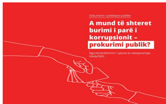
Документ за јавна политика