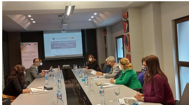
Работни состаноци со О ЈО ГОКК и ДКСК