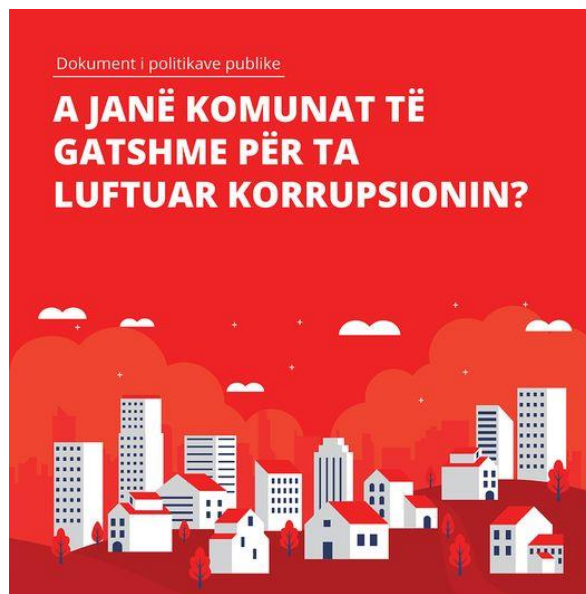
Документ за јавна политика