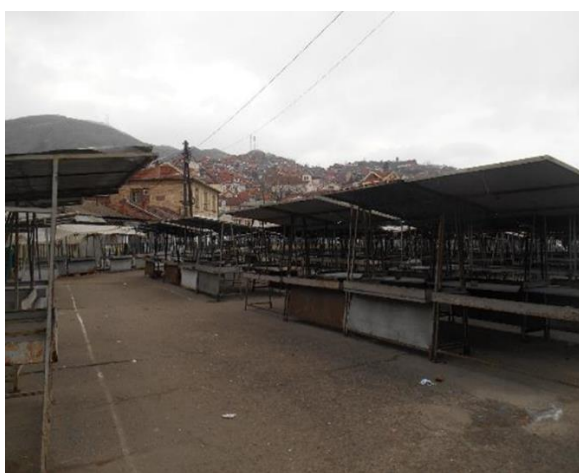
Фотографии, дел од документите за оценка на проекти

Проектот е финансиран од Светска Банка, преку Министерството за Финансии.