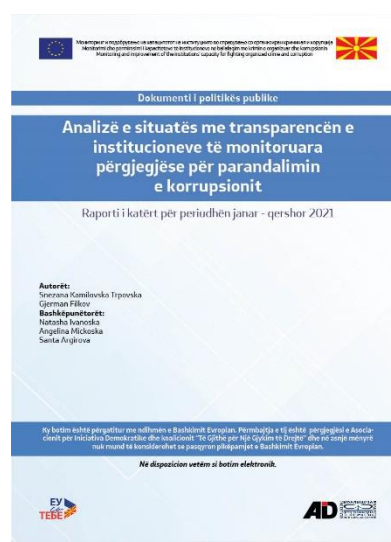
Документ за јавна политика