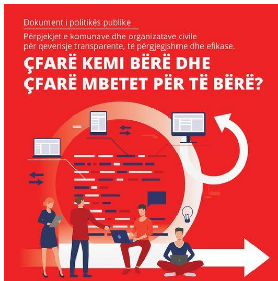
Документ за јавна политика

Проектот е спроведуван од Ист Вест Менаџмент Институт (EWMI) во партнерство со: Асоцијацијата за демократски иницијативи (АДИ), Фондацијата за интернет и општество "Метаморфозис", Фондацијата отворено општество Македонија (ФООМ), и Националниот Младински Совет на Македонија.