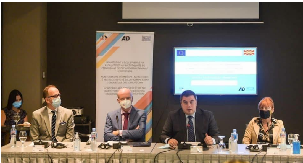
Завршна коференција Напредокот во борбата против организираниот криминал и корупцијата