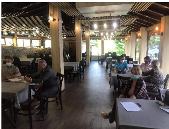
Работилница за стратешко планирање